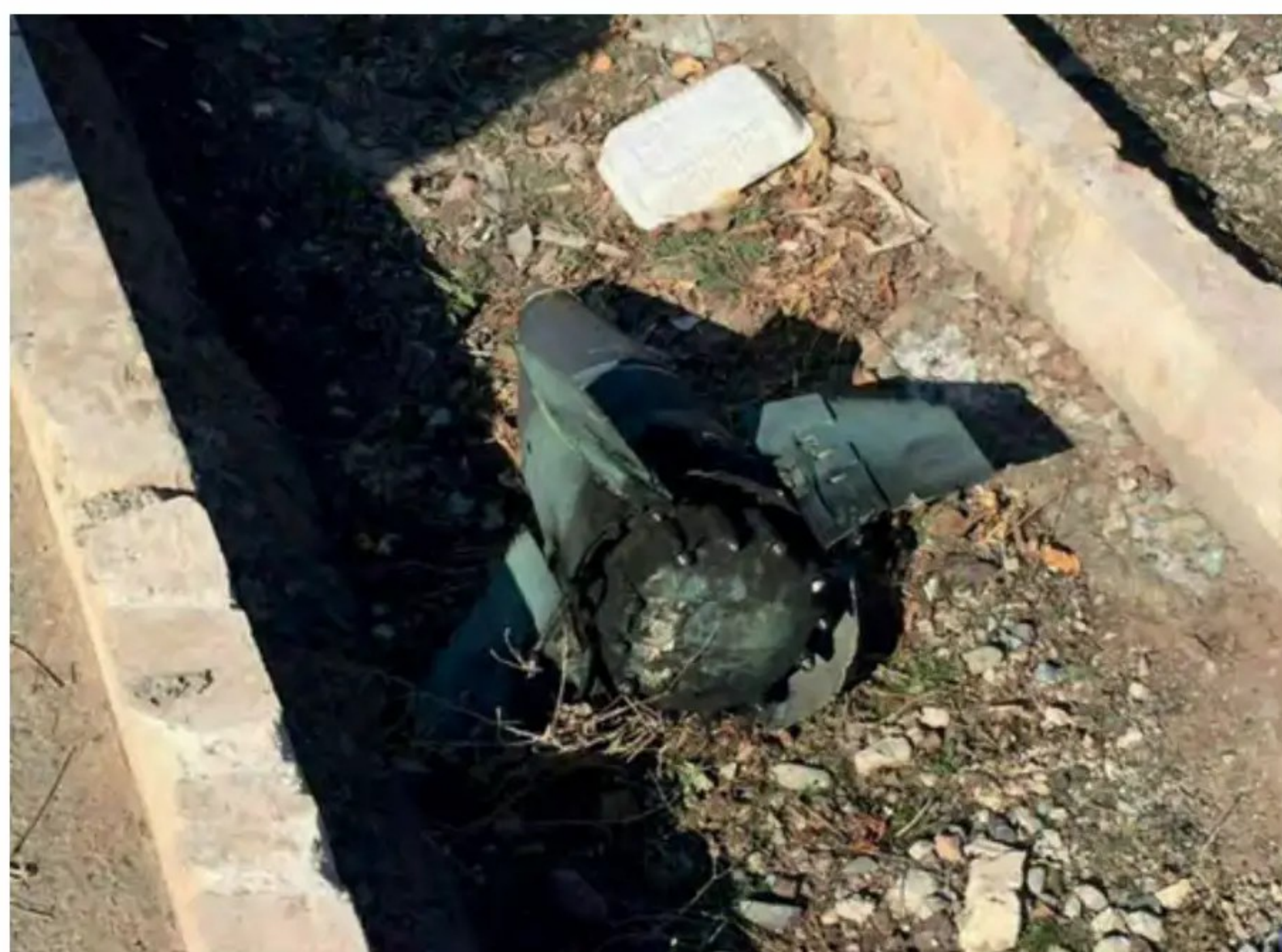
Derecha: Evidencia clara del impacto de un misil: el vuelo PS752 fue derribado sin duda alguna.

pesar de ello, apenas dos minutos tras el despegue, el Cuerpo de Guardianes de la Revolución Islámica (IRGC) confundió el avión comercial Boeing 737-800 ucraniano con un misil de crucero estadounidense, disparando dos misiles desde su sistema de defensa de misiles tierra-aire (SAM).