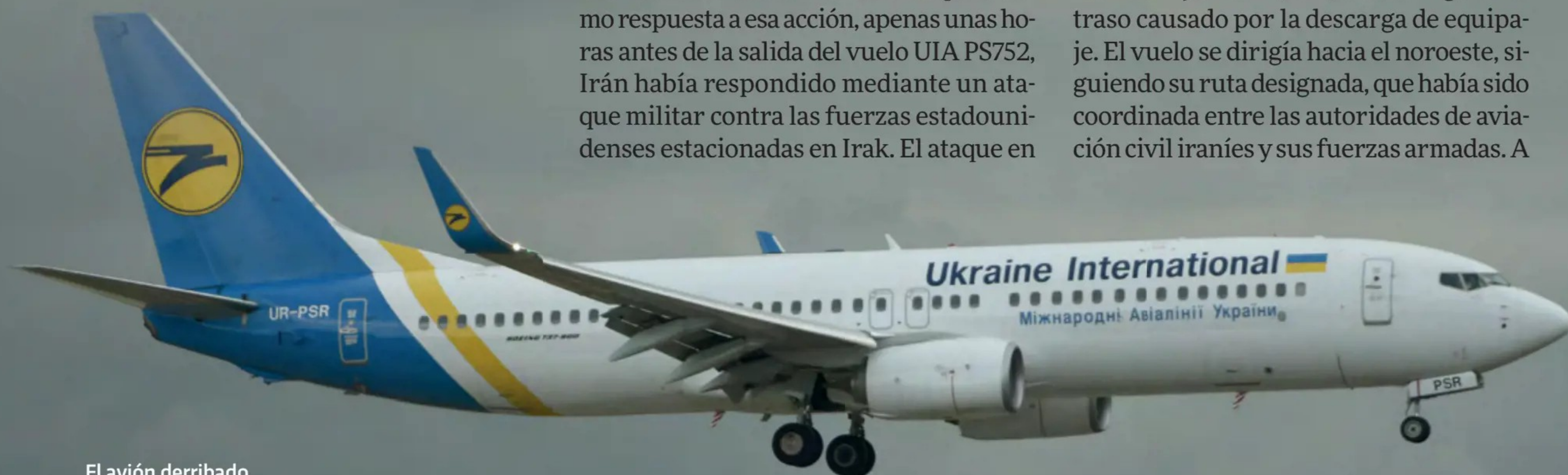
El avión derribado fotografiado en Barcelona.

A las 06:12 hora de Teherán (TT), el vuelo PS752 de Ukraine International Airlines (UIA) partió del Aeropuerto Internacional Imam Jomeini (IKA) tras un ligero retraso causado por la descarga de equipaje. El vuelo se dirigía hacia el noroeste, siguiendo su ruta designada, que había sido coordinada entre las autoridades de aviación civil iraníes y sus fuerzas armadas. A