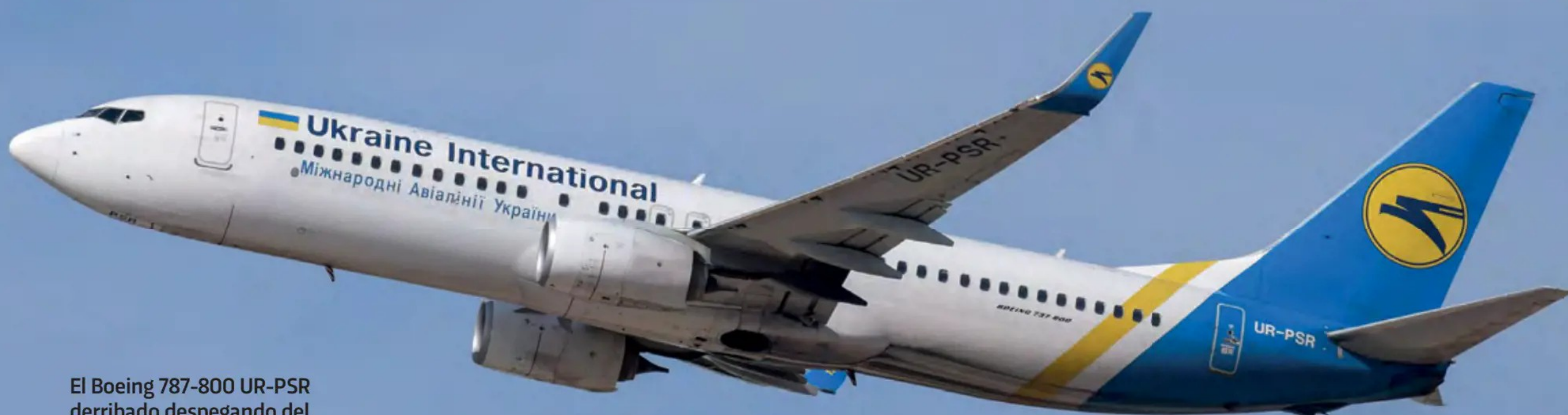
El Boeing 737-800 UR-PSR derribado despegando del aeropuerto Ben Gurion, Tel Aviv.

que el impacto de un suceso de este tipo va más allá de la terrible y trágica pérdida de vidas humanas. Los operadores corren este riesgo de responsabilidad ilimitada, lo que hace que la necesidad de evaluaciones de riesgo obligatorias, de una gestión de riesgos regulada, previsoras y preventivas sea un requisito claro que necesita ser defendido. AR