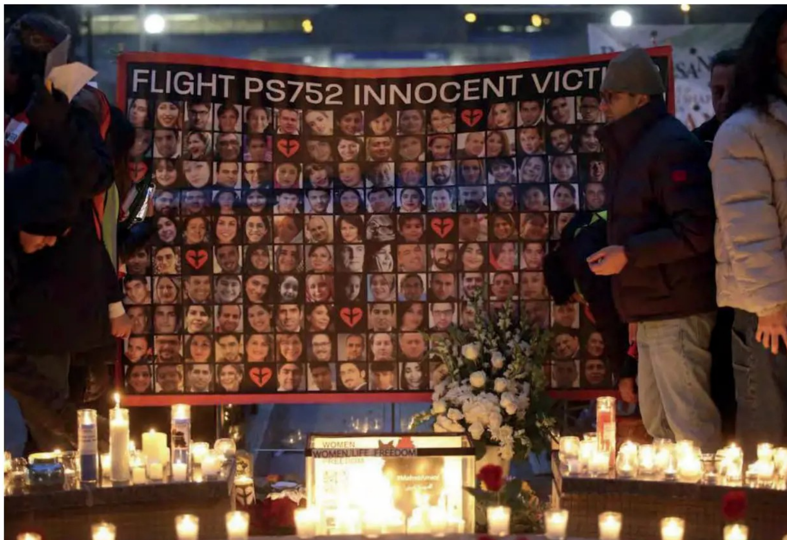
Arriba: El siniestro se cobró la vida de los 167 pasajeros y 9 tripulantes.